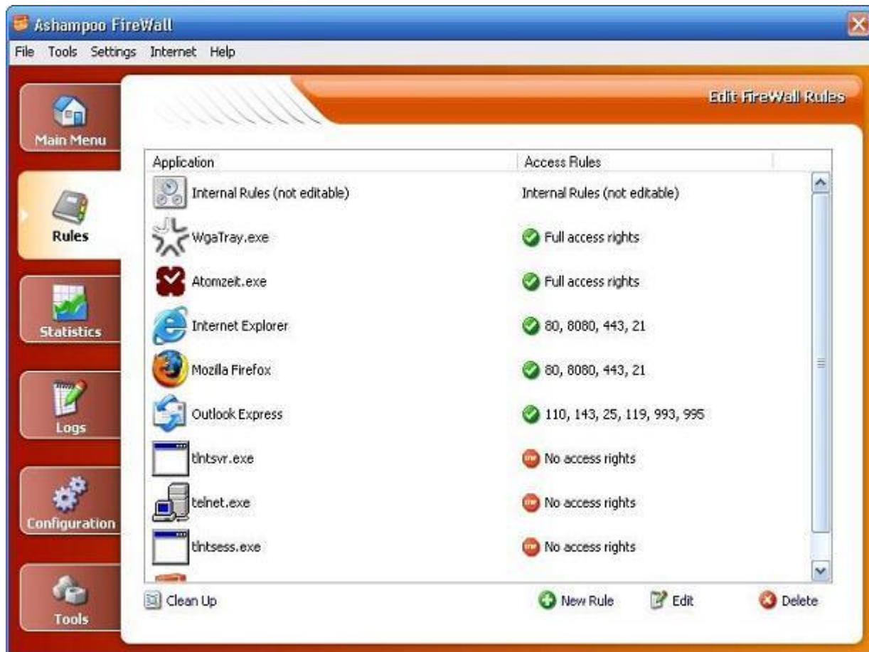
Рис. 1. Внешний вид интерфейса программы Ashampoo Firewall Free

Наиболее популярным на сегодняшний день среди антивирусов считается продукт Лаборатории Касперского. Антивирус Касперского предоставляет пользователю защиту от вирусов, троянских программ, шпионских программ, руткитов, adware, а также неизвестных угроз с помощью проактивной защиты, включающей компонент HIPS[56].