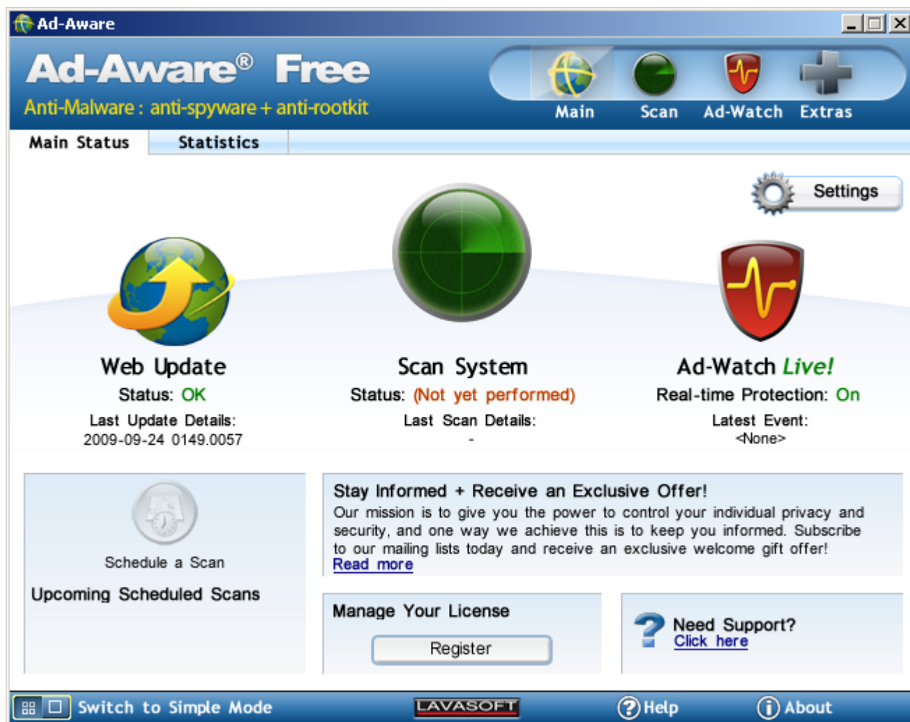
Рис. 3. Внешний вид интерфейса программы Ad-Aware

Внешний вид приложения представлен на рисунке 3.